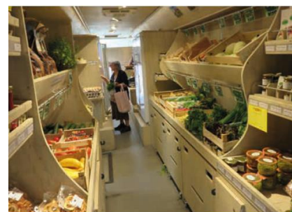
Aménagement Interne du bus

Les partenaires de l'opération sont : l'OPABA (étude de faisabilité en lien avec l'entreprise Les Ateliers de la Terre), l'AERM (subventions de 70% de l'étude et 25% de l'investissement), la Région (subventions étude et investissement), l'Association pour le Développement de l'Alsace du Nord (aide à l'emploi 10 000€ et portage politique), le FSE (subvention à l'emploi 23 000 €) et la Ville de Haguenau (portage politique).