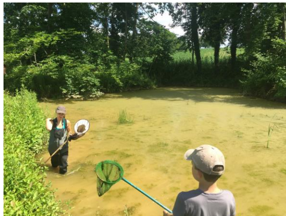
Après travaux, juin 2018

Après travaux, le réseau de mares a gagné en ensoleillement et en diversification de zones humides. Les zones terrestres attenantes recouvertes par une végétation herbacée spontanée et la création d'un talus écologique qui accueille diverses plantations arbustives locales offrent de nouveaux habitats. Une petite roselière commence à se développer au nord du ruisseau laissant présager une colonisation progressive du réseau.