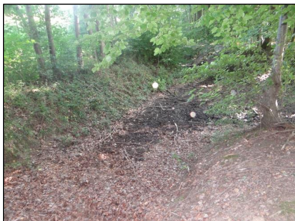
Avant travaux, juillet 2015